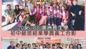
2025.03 澳洲長生學初中級班結業學員義工合影