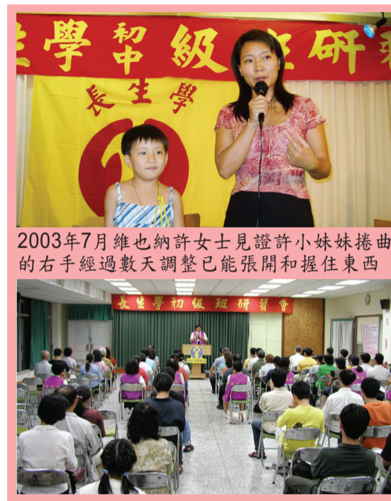
2003年7月維也納許女士見證許小妹妹捲曲的右手經過數天調整已能張開和握住東西