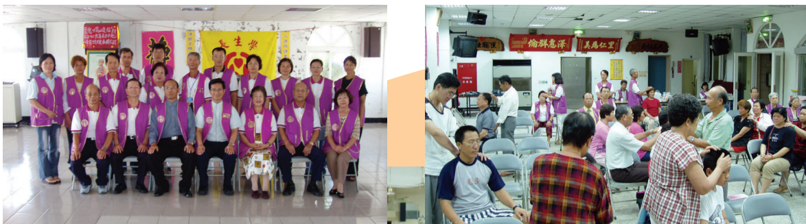
2003年6月份老師與同學在馬六甲