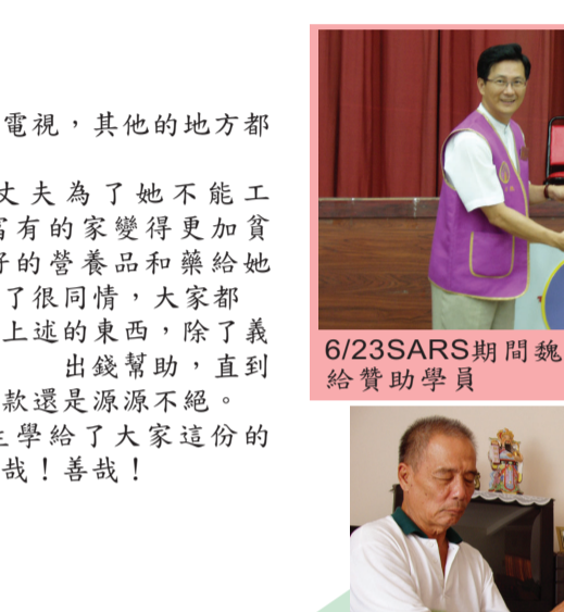
6/23SARS期間魏老師於 閩頌感謝狀給贊助學員