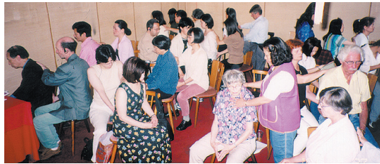
5/27長生學在德國曼海姆市上課情形