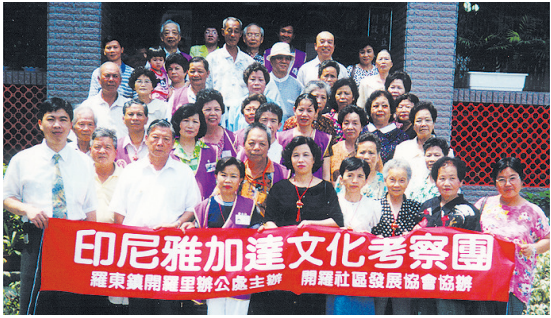
6/3羅東鎮開羅社區瑪利亞仁愛之家關懷之旅