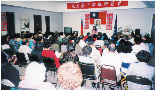
4/26美國舊金山長生學開課會場一隅