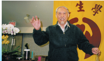
4/17感謝加拿大溫哥華地區范爾銳律師義務幫我們在加國申請長生學團體的註冊與愛心站的提供

另外幾次幫我的孩子調整感冒，也是一手C7另一手C5，之後一手C5另一手放於氣管，效果都有改善。