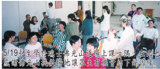
5/19長生學於瑞士佛光山道場上課一隅，左起也感謝佛光山提供場地讓眾生有機會結下好因緣